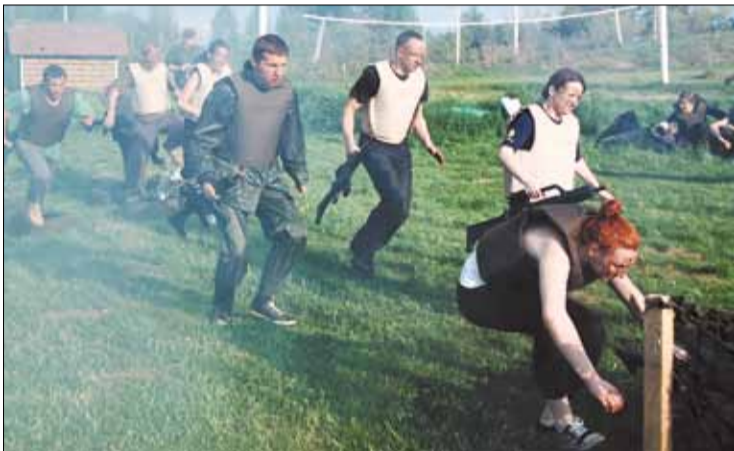
Darbdaviai bando įveikti kliūčių ruožą