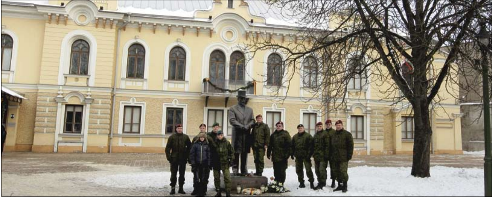
Vasario 16-osios proga KASP štabo darbuotojai apsilonkė Pirmosios respublikos prezidentūroje Kaune