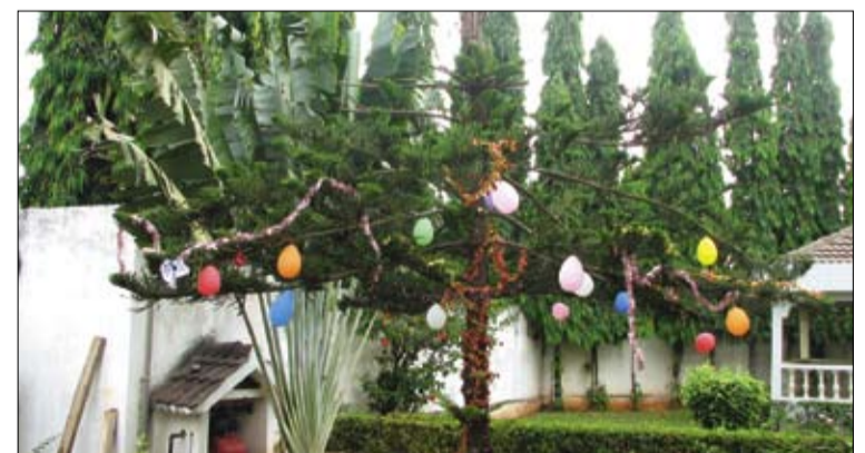
Improvizuota Kalėdų egulutė, europiečių papuošta Togo respublikoje