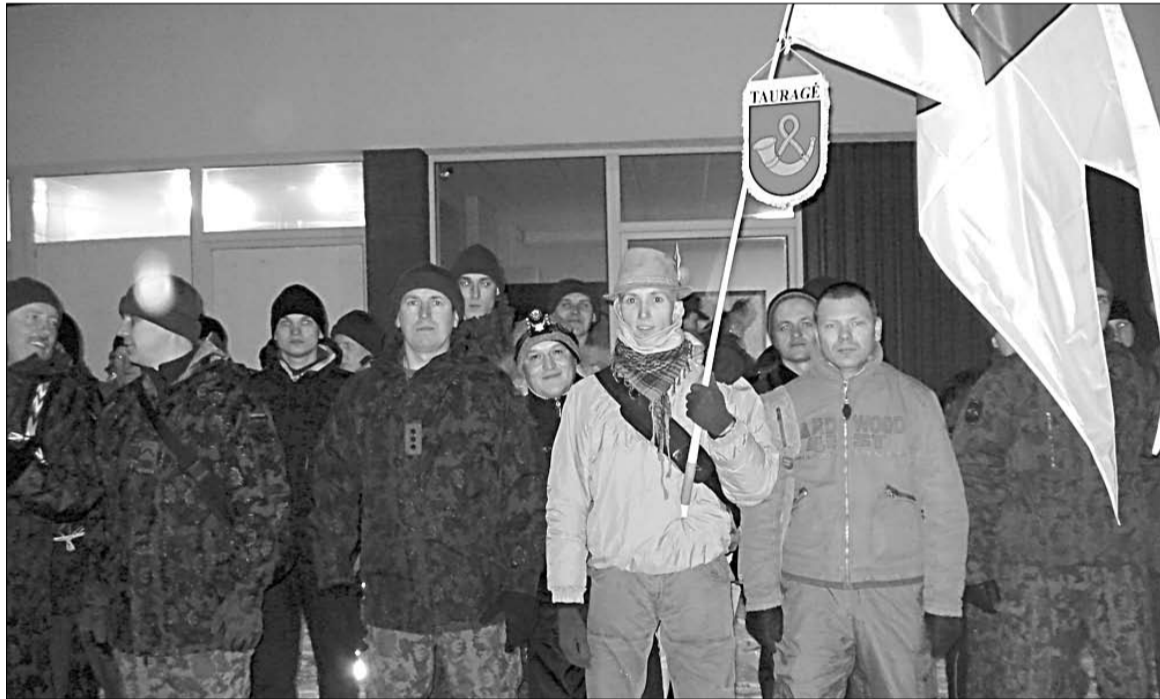
Tauragės 307-osios kuopos žygeivių komanda