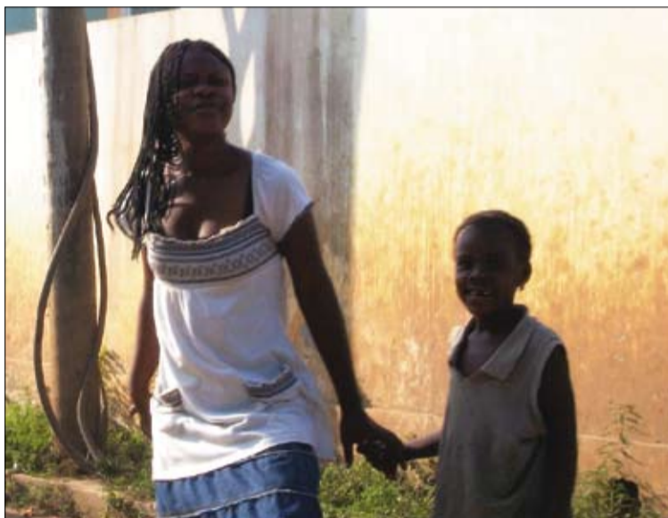
Konge sveikindavusi prancūziškai, o man atsakydavo lietuviškai!

nios valandos manęs visai neramino, galvoje sukosi įvairiausių mintys „kas bus, jeigu...“. Mano kantrybė vis seko ir aš vis dažniau ėjau darbuotojų klausiti, ar yra žinių apie mano skrydį, bet atsakymas visada buvo toks pat. Visiškai nedžiugino ir ant kelių vis puolančios ir vėl besistojantys laukiantieji musulmonai – jų maldos metas. Vis labiau rankose spaudžiau baltąjį plastiko gabalėlį. Galiausiai, po kelių valandų laukimo, darbuotojų vėl paklausiau, ar yra naujienų. Staiga paaiškėjo, kad kaip tik tuo metu vyksta laipinimas. Eilinį kartą įsitikinau, kad tikrai buvau pamiršta.