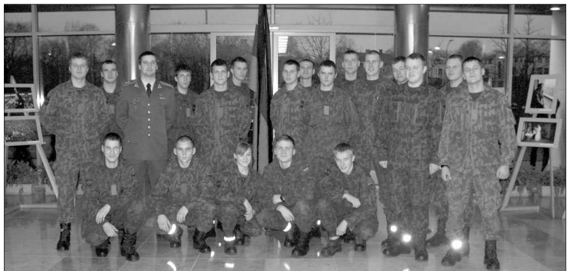
Skuodo savanoriai Seime

leivių pranešimus, jų pasididžiavimą nepriklausoma Lietuva ir padėką nepriklausomybę apgy-nusiems.