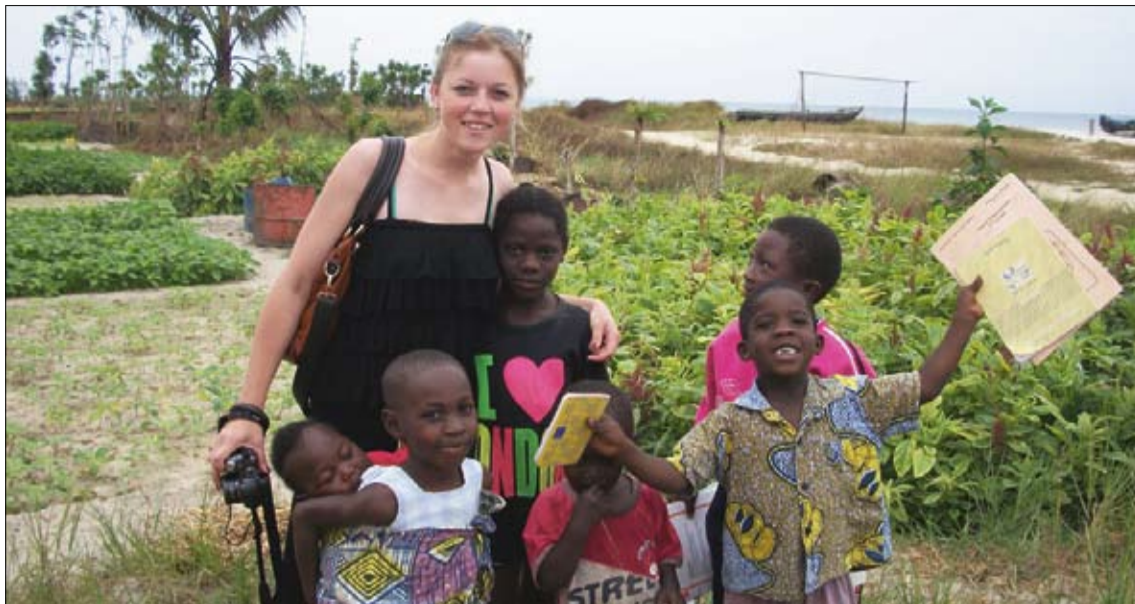
Vaikai visur vienodi. Žvejo šeima Gabone

Kelionė iš Togo į Pusiaujo Gvinėją nebuvo labai maloni. Susiklosčiusi situacija taip pat labai nežavėjo. Nuskridusi į Beniną likau viena. Tik paprašius vietinių darbuotojų, buvau palydėta iki oro uosto, kur mane perdavė kažkokiai moteriškei, kuri aiškiai kalbėjo gražia prancūzų kalba, bet tai manęs neguodė. Aš prancūziškai moku tik kelias frazes. Kadangi neturėjau tos šalies vizos ir net nebuvo priežasties ją gauti, darėsi vis neramiau. Galiausiai pavyko gauti „transitinę vizą“ – paprasčiausią baltą plastikinę kortelę – kuri tapo svarbiausiu mano įrodymu, jog į šalį atvykau ir išvyksiu legaliu būdu. Po ilgų klaidžiojimų neaiškiais koridoriais pagaliau pasiekiau laukimo salę. Moteriškė dar paaiškino, jog kai bus mano skrydis, ji mane pakvies ir kažkur dingi. Iki skrydžio buvo likusios dvi valandos. Laukimo salė vis prigužėdavo juodaodžių ir vėl ištuštėdavo. Artėjant mano skrydžiui laikui pasidarė įtara, kad esu pamiršta. Minėtosios moteriškės nebuvo matyt. Galiausiai paaiškėjo, kad mano skrydis atidėtas dėl neaiškių priežasčių ir neaišku kuriam laikui. Dar kelios neži-