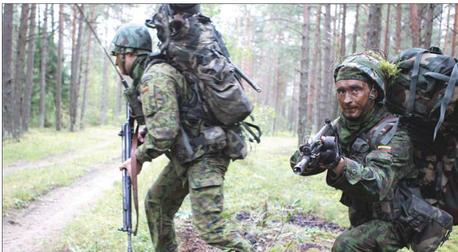
Didžiosios Kovos rinktinės savanoriai Pabradės poligone.