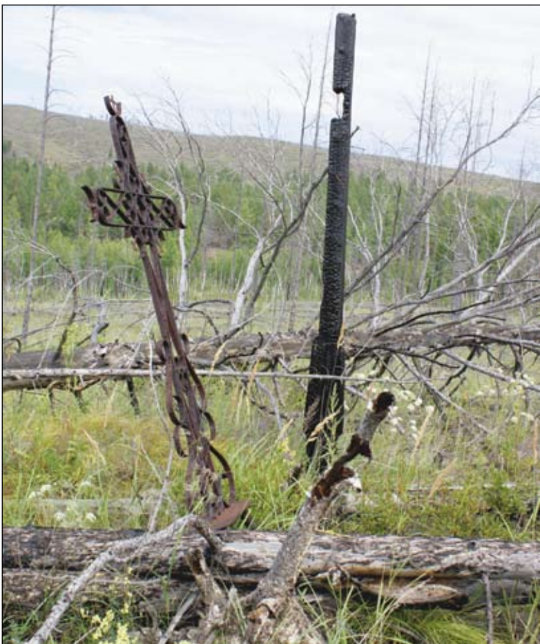
Taip atrodo lietuvių kapai Sibire