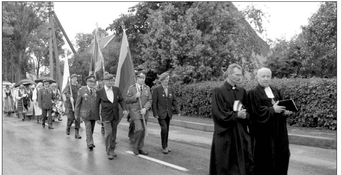
Eisena Papilio gatvėmis

Kapinių šventę (tai pamaldos kapinėse ir mirusių paminėjimas, nes reformatai už mirusiuosius nesimeldžia, tik juos prisimena. Konformacijos laikais kilęs paprotys, kai rinktis nepersekojamiems tebuvo galima tik kapeliuose) laikė jau minėtieji kunigai. Buvo prisimena-