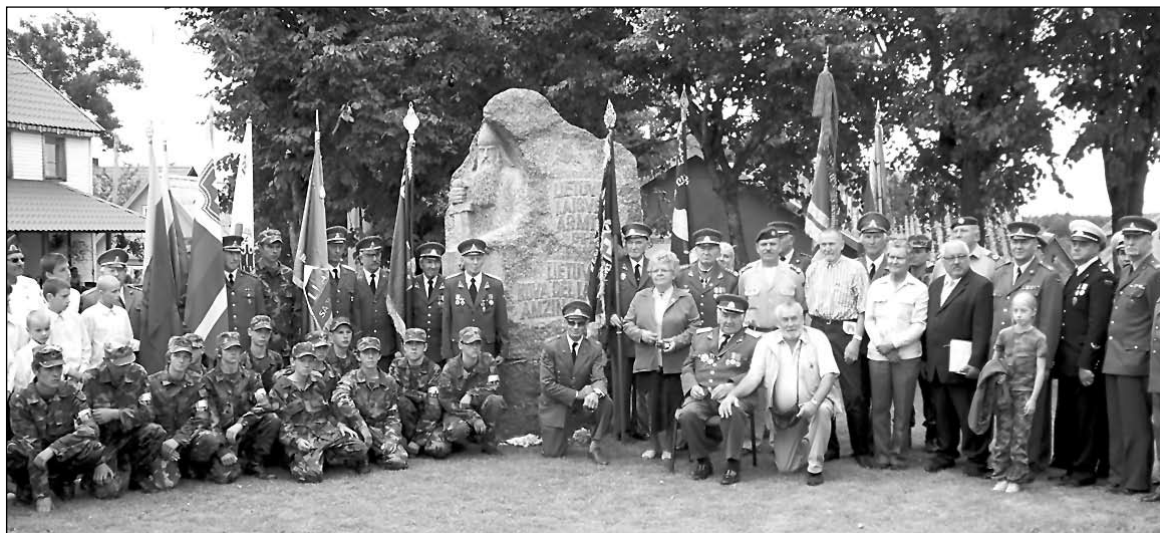
Prie paminklo Lietuvos laisvės armijai Plateliuose