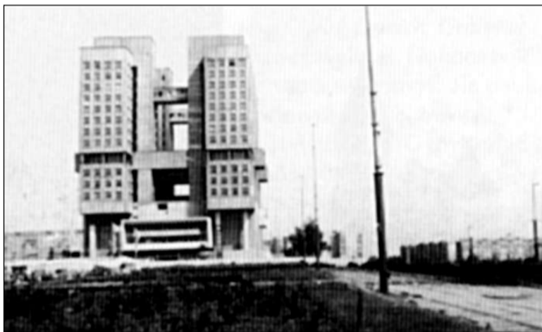
Pilis nušluota nuo žemės paviršiaus, jos vietoje riogso nebaigtas statytis griozdas.

apie tai ir žinoma. Vakarų sąjungininkai apsimetė naivuoliais, girdi, tai tik vokiečių propaganda, tačiau tai nebuvo propaganda, o III Baltarusijos fronto vado gen. Ivano Černiachovskio įsakymo vykdymas. Jo pagalbininkas propagandai žydas rašytojas Ilja Erenburgas sukūrė specialų atsišaukimą, raginantį narsiuosius raudonarmiečius be gailės žudyti vokiečius ir prievartauti jų moteris. „Žudykite! – rašė Erenburgas, – juk nėra tokio tarp jūsų, kuriam būtų nekalčių vokiečių“.