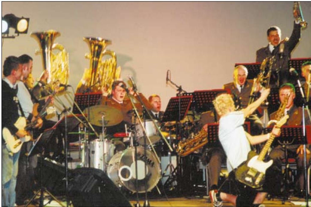
Kartu su orkestru koncertavo ir populiari grupė „Biplan“.